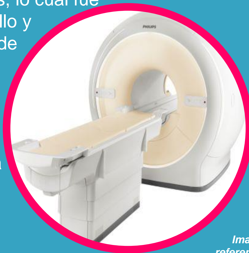
Imagen referencial de Resonador adquirido por Hospital Gustavo Fricke.

El Resonador es un equipo especializado en la obtención de imágenes de alta precisión en dos y tres dimensiones por medio de un campo electromagnético, que contará con una capacidad para generar exámenes a una población proyectada de alrededor de tres mil personas al año.